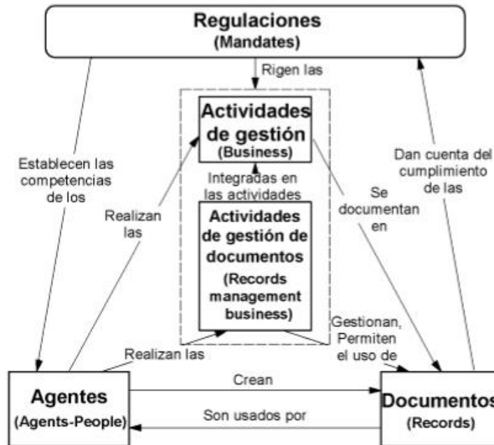
Figura 1 Modelo conceptual de entidades: principales entidades y sus relaciones