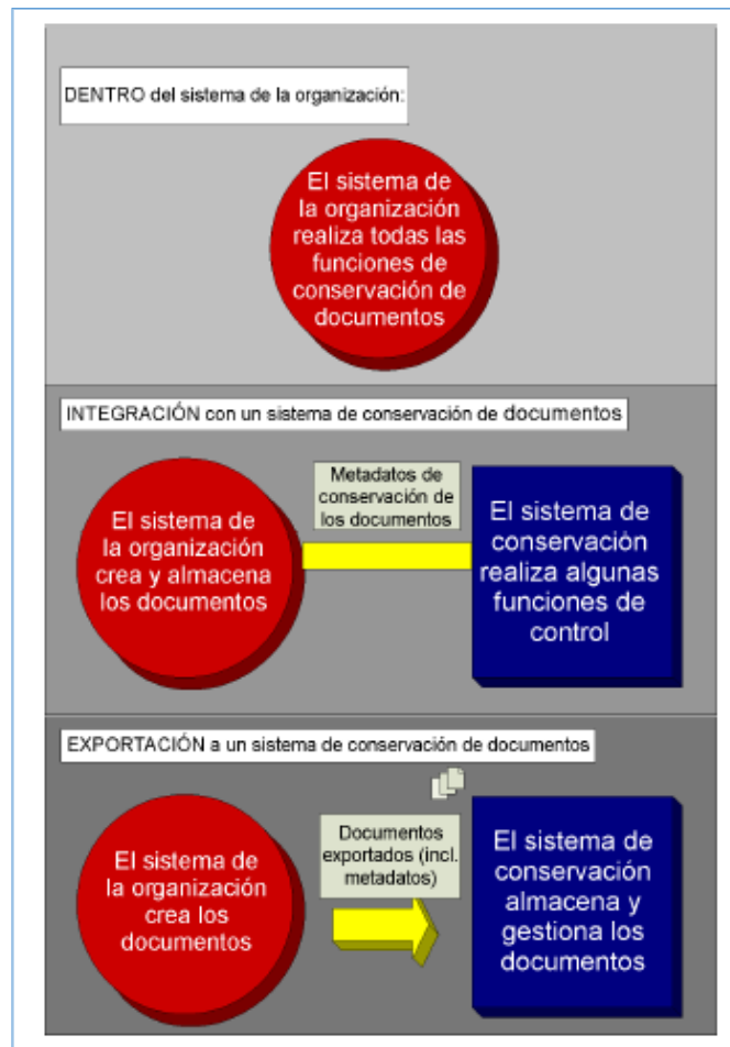
Figura 4 Posibles opciones del sistema para gestionar los documentos creados en un sistema de la organización